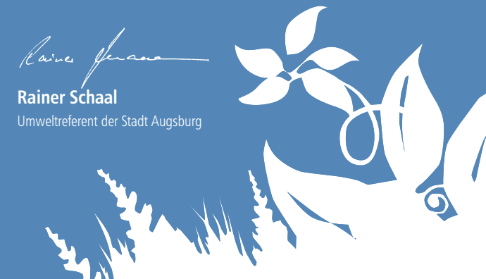
Rainer Schaal Umweltreferent der Stadt Augsburg